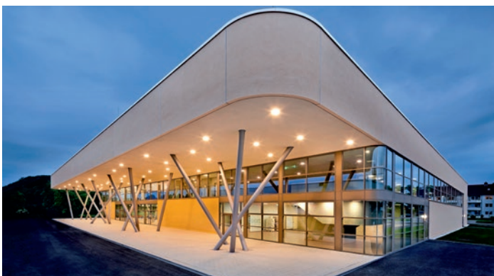
Die ungewöhnliche Vordachkonstruktion am Eingangsbereich zieht die Blicke der Nutzer auf sich.

Im ersten Obergeschoss der Sporthalle sind ein Trainingsraum für die Ringer des TSV Herbrechtingen und vier Multifunktionsräume mit Umkleiden untergebracht. Die Gebäudetechnik befindet sich zentral in einem Technikgeschoss über den Hallen. Die atmosphärisch angenehme Holzverkleidung an den Wänden und an der Decke der Mehrzweckhalle ist schallakustisch wirksam und dient im unteren Bereich als Prallwand. Der Parkettboden rundet den festlichen Charakter des Raumes ab. Höhepunkt der Gestaltung der neuen Bibrishalle ist jedoch das wie von Mikado-Stäben getragene, weit auskragende Vordach der Halle, das ein einladendes Zeichen für alle Sport- und Kulturtreibenden in Herbrechtingen und weit darüber hinaus setzt. ■