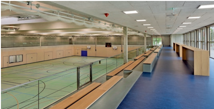
Hinter der gläsernen Galerie und auf den im unteren Bereich ausfahrbaren Tribünen finden 700 Zuschauer Platz.

Als Generalplaner hat der WLSB-Partner campus die neue Bibrishalle in Herbrechtingen entwickelt. Ihre Gestaltung kommt sehr gut an