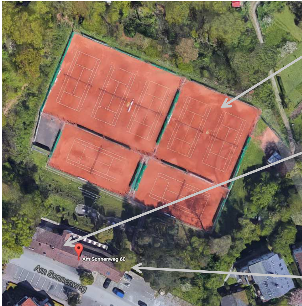
Tennisanlage mit 7 Plätzen